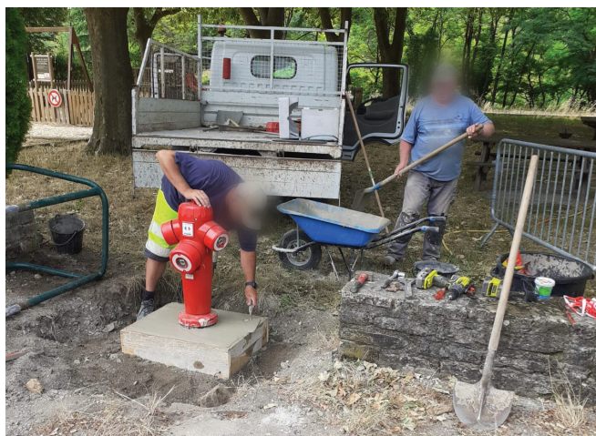
Au quartier de la Ginestière

SÉCURITÉ – À la suite de la vérification annuelle obligatoire de nos poteaux et bouche incendie nous avons changé des poteaux incendies qui présentait des défaillances.