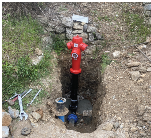
Au quartier des Pins